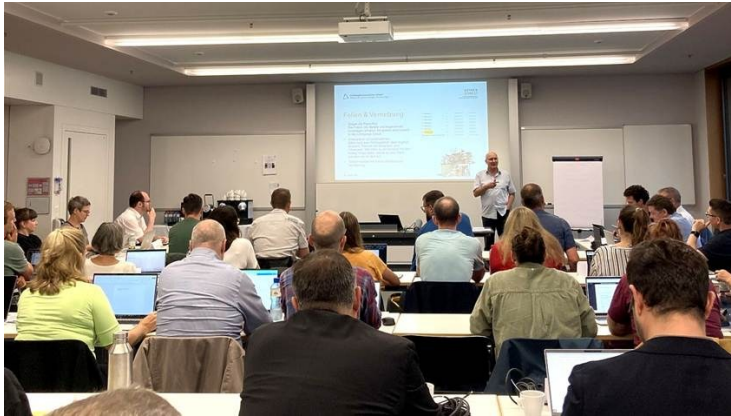
Bildung-Wohnen Lehrgang: Management von gemeinnützigen Wohnbauträgern

Verband der Baugenossenschaften Fédération des Coopératives de Construction