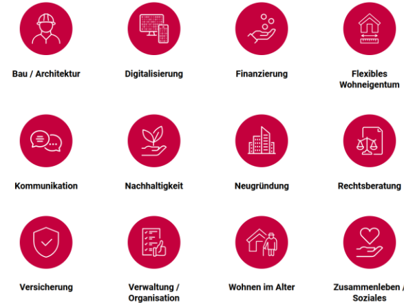
Neue Angebote und Dienstleistungen Ausbau Dienstleistungsangebot und Fachkompetenz mit Partnern