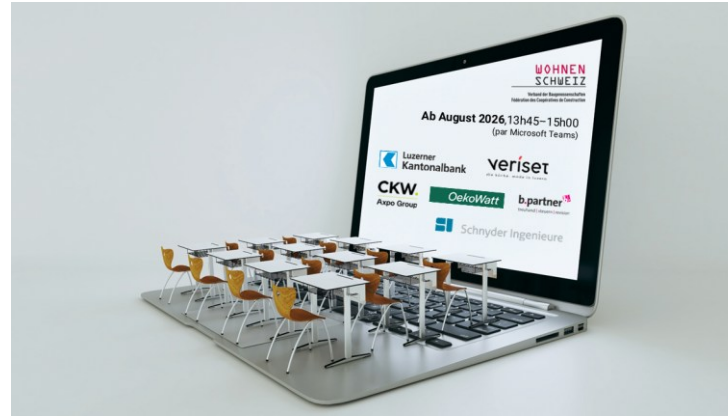
eWeiterbildung Online-Kompaktschulungen für die Deutschschweiz