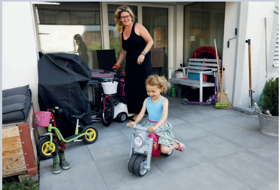
Au rez-de-chaussée, les familles peuvent profiter de la terrasse.