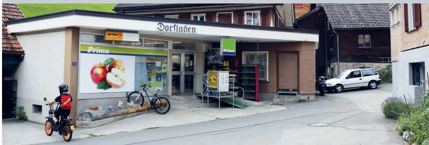
Des logements locatifs ont vu le jour au-dessus du magasin du village.

Au début, l'idée était de sauver le magasin du village. Mais la commune de montagne du canton d'Uri, qui dispose de peu de moyens, a aussi réussi, pas à pas, à gagner en attractivité pour les jeunes. Construire des logements pour personnes âgées pourrait être la prochaine (grande) étape.