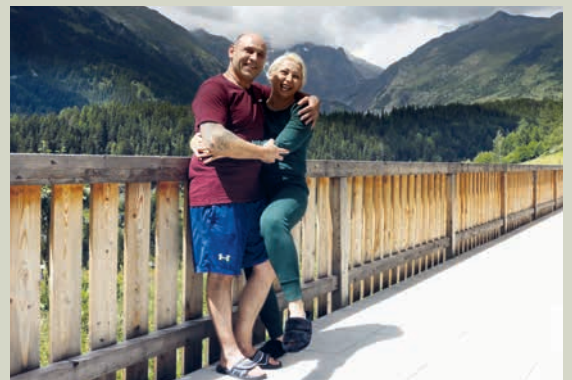
La grande terrasse offre de l'espace supplémentaire aux occupants.

Le modèle coopératif a fait ses preuves : grâce à lui, la spéculation n'a pas de prise sur ces logements.