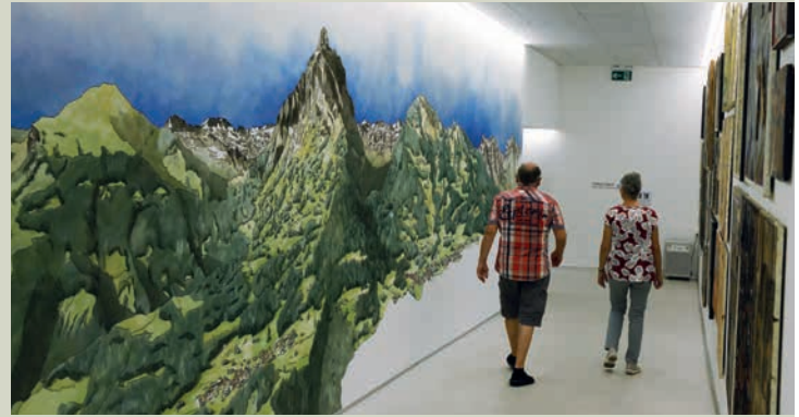
Un couloir souterrain relie l'immeuble d'habitation au magasin et au restaurant.