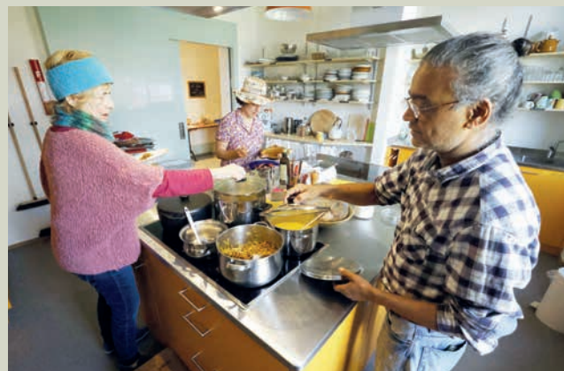
... a été préparé dans la cuisine commune.

Plus que centenaire et de style Art nouveau, l'hôtel Belmont, magnifiquement situé sur les hauts de Wilderswil, est longtemps resté inoccupé et sa démolition était programmée. Jusqu'à ce qu'en 2013, deux retraitées venues de la plaine souhaitent y matérialiser leur vision d'une nouvelle forme d'habitat : en communauté, à des prix conformes à ceux du lieu, et dans le respect de l'environnement.